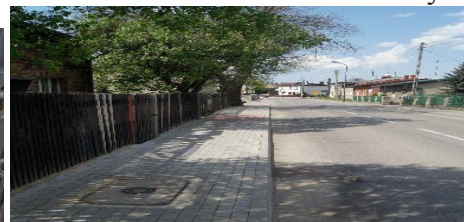
...i po wykonaniu inwestycji.