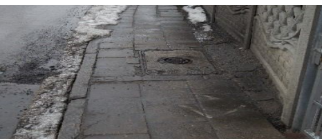
Chodnik przed wykonaniem inwestycji...