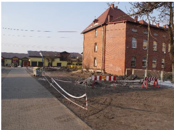
Plac przed wykonaniem inwestycji...