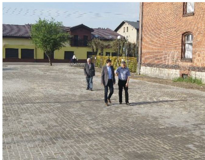
... i po wykonaniu inwestycji